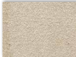
32 4m + 5m