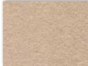
38 4m + 5m