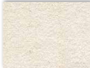
05 4m + 5m