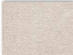
16 4m + 5m