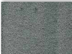
74 4m + 5m