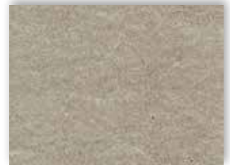
90 4m + 5m