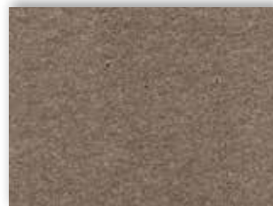
45 4m + 5m