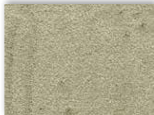
29 4m + 5m