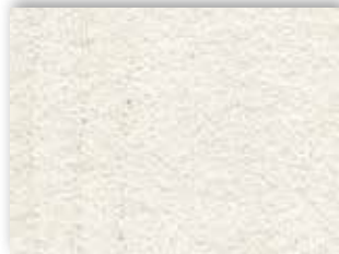
03 4m + 5m