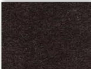
99 4m + 5m