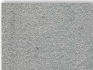
72 4m + 5m