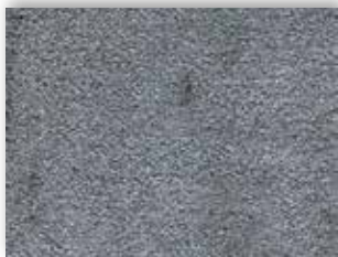
75 4m + 5m