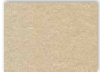
33 4m + 5m