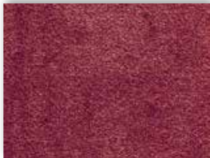
11 4m + 5m