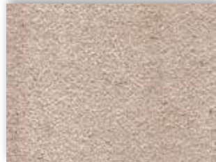
31 4m + 5m