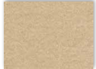
34 4m + 5m