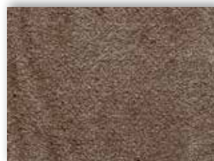
49 4m + 5m