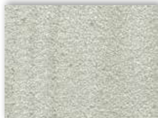
27 4m + 5m