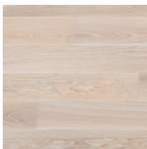
Prestige Eiche Sand weiß