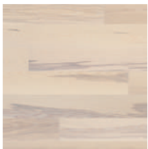
Prestige Esche Seashell